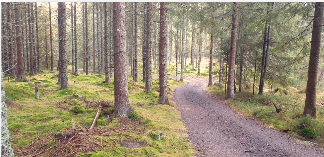
(bildet viser Lillomarka)

Skognæringen må gis gode vilkår. Skogsbilveier bygges for drift og skjøtsel av skogen. En positiv effekt er at veiene også bidrar til at innbyggere kommer seg ut i naturen og kan utøve friluftsliv. En stadig effektivisering gjør tømmerbilene tyngre og lengre. Et hardført veinett er derfor grunnleggende viktig for å forvalte skogressursene.