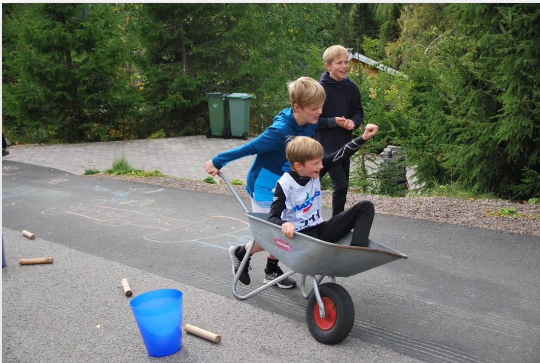
(barn som samarbeider om å kjøre trillebår)

Prøysentorget må få mer aktivitet! Lekeplass, benker, beplantning og enkel servering er blant forslagene vi har til et mer aktivt torg. Sp ønsker dialog med eierne av de gamle serveringslokalene på Prøysentorget, slik at vi kan etablere noe av det vi beskriver, der.