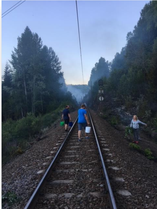
Foto: Anne Glestad Lech, Nittedal Sp (Lokalbefolkningen slukker brann på Gjøvikbanen)