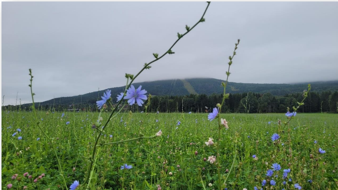
(Eng med blomster og Varingskollen i bakgrunnen)

Vi vil vektlegge å ta vare på kulturlandskapet i den videre sentrumsutviklingen. Det er viktig å sørge for fortsatt god forvaltning av jord og skog. Matproduksjon og skogbruk er ikke bare for bonden – det har betydning for hele samfunnet.