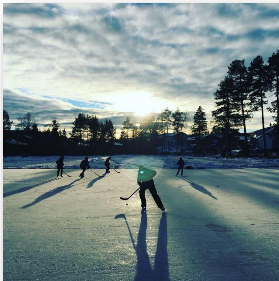
(balansekunst – barn og unge som spiller ishockey)